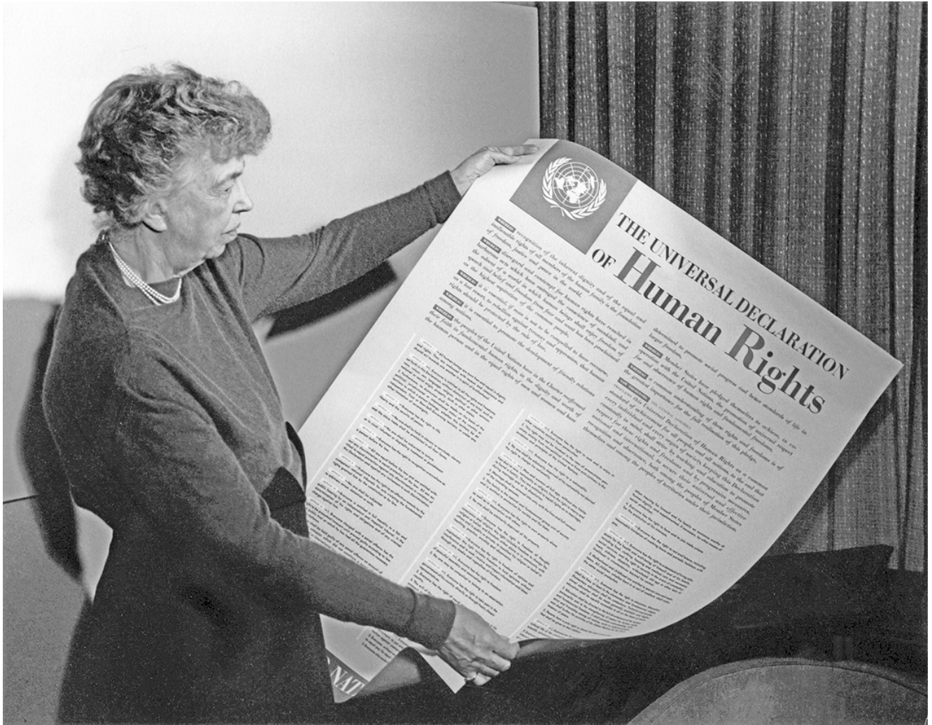
Eleanor Roosevelt: Declaración Universal de los Derechos Humanos

Considerando el contexto del nuevo milenio y cuáles eran los retos de la educación que había que enfrentar para ese momento y años posteriores, se desglosaron una docena compromisos en los que las naciones deberían trabajar durante la primera década del siglo XXI. De entre ellos, resalta el sexto objetivo “aplicar estrategias integradas para lograr la igualdad entre los géneros en materia de educación, basadas en el reconocimiento de la necesidad de cambiar las actitudes, los valores y las prácticas” (UNESCO. 2000, p. 9).