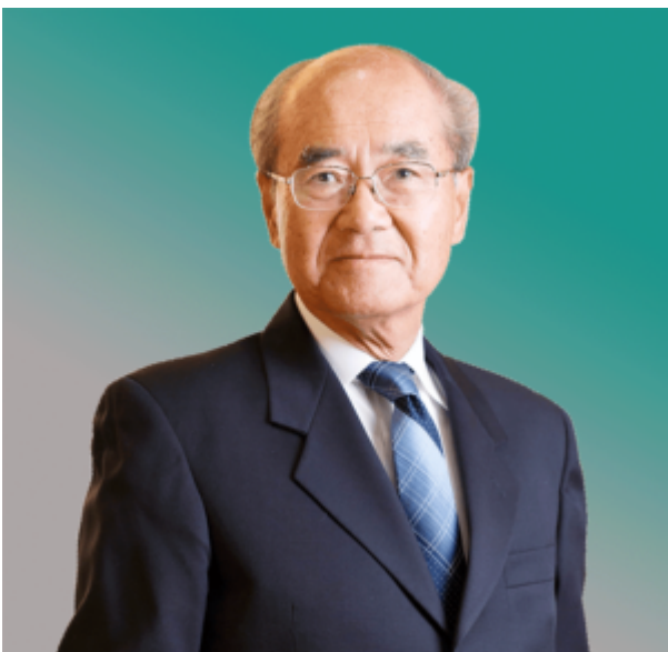
Dr Koichiro Matsuura Director UNESCO

Como consecuencia, a nivel internacional, surgieron iniciativas como la Declaración Mundial sobre Educación para Todos en Jomtien, Tailandia en 1990, durante el Foro Mundial sobre Educación . En dicha Declaración se proclamó la necesidad de proporcionar oportunidades básicas de aprendizaje a todos los seres humanos, refiriendo en su primer artículo " Satisfacción de Necesidades Básicas de Aprendizaje (NBA) ":