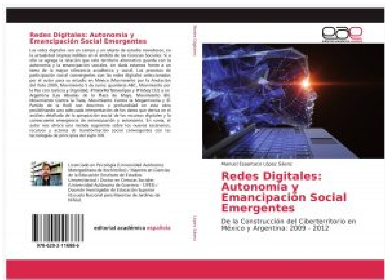
Portada y contraportada del libro de Manuel López Sáenz, en su edición española

Por tanto, se puede afirmar que esta obra es un referente obligado para el investigador en la materia y los interesados en el tema de los usos sociales de las Nuevas Tecnologías de la Información y la Comunicación; asimismo, constituye un recurso pedagógico para el acercamiento a la metodología de investigación de corte cualitativo desde una perspectiva hermenéutica con un lenguaje accesible y sumamente actualizado.