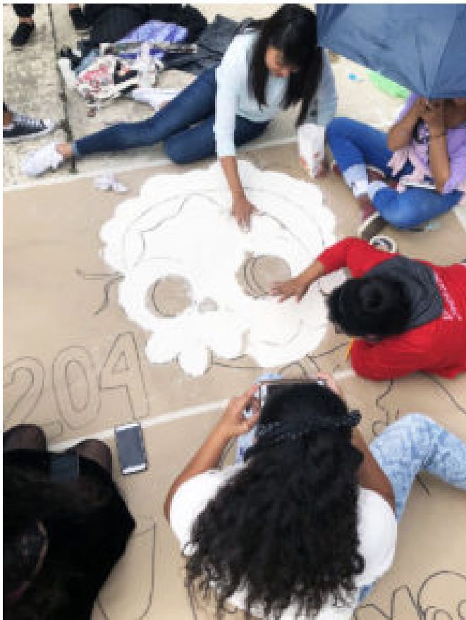
Estudiantes trabajando en el tapete de María Montessori

más de una risa en varias ocasiones; sin duda, fue el momento humorístico del programa. Llegó luego el momento de escuchar al recién conformado Ensamble Instrumental de la ENMJN , integrado por trabajadores y docentes, acompañados para este evento, así como de las estudiantes de los grupos 301, 302 y 402, todos ellos dirigidos por el Mtro. Adrián González Peña. Su participación, alusiva a la fecha fue: La Llorona .