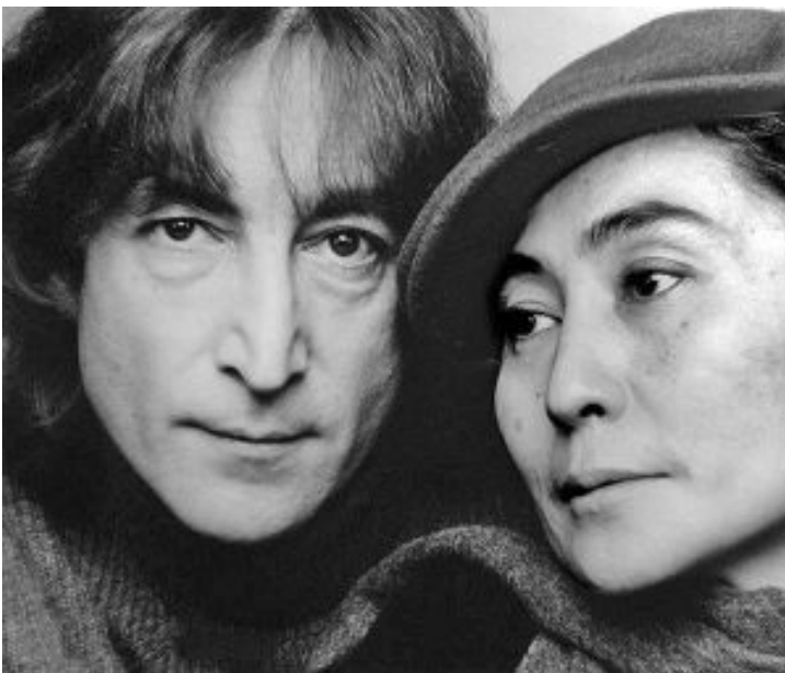
John Lennon y Yoko Ono

“El cristianismo se irá. Se desvanecerá y reducirá su tamaño [...]. Somos más populares que Jesús ahora —no sé qué se irá primero, si el rock and roll o el cristianismo”.