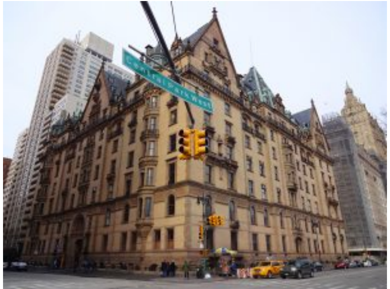
Edificio Dakota en Nueva York

“La declaración de John Lennon, que provocó una profunda indignación, después de muchos años suena tan sólo como una fanfarronada de un joven de clase trabajadora de Inglaterra, que tuvo que afrontar un éxito inesperado, después de crecer en la leyenda de Elvis Presley y del rock and roll.”