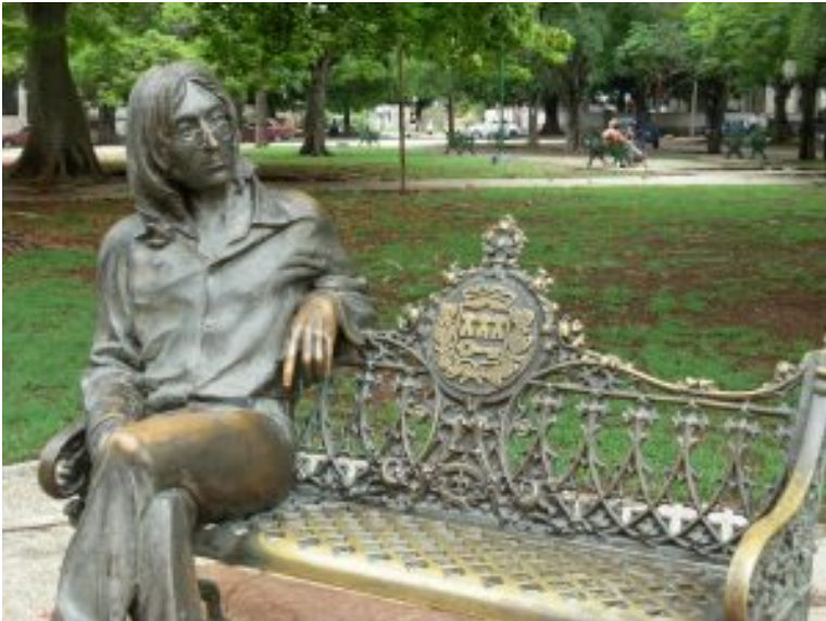
Estatua de Lennon en Cuba