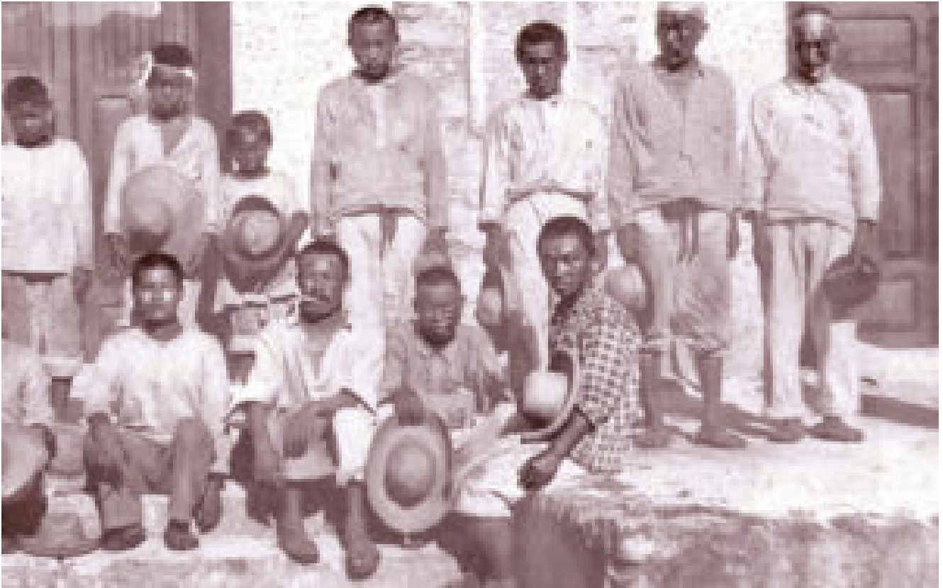
Trabajadores chinos en México a principios de siglo XX

Ante el despliegue de la presente situación, podría justo pensarse que México, en relación a China, revelaría un proceso económico distinto, con desarrollos rurales e industriales latentes; sin embargo, hoy día, la nación China es simplemente una potencia económica mundial, a punto de arrebatarle a Estados Unidos su papel y su sitio protagónico.