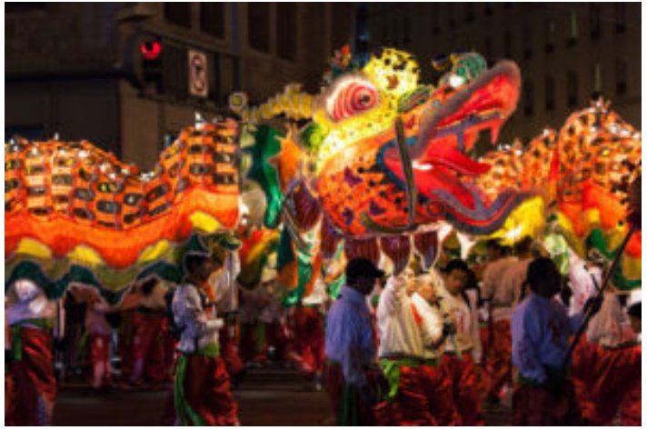
festejo del año chino, en el centro de la capital

Los indicios de la relación sino-mexicana (o chino-mexicana) son muy antiguos, los encontramos desde la época colonial en la Nao de China , con sus largas travesías desde lejano oriente hasta puertos españoles, y, sin duda, hasta la Nueva España y a Filipinas; en este recorrido, eran transportados diversos productos chinos, tales como seda, porcelana, especias, té verde, etc. De manera complementaria, había diversos productos de la Nueva España, como la plata mexicana, que eran llevados por las mismas embarcaciones hacia los mercados chinos y de Japón. Por cierto, este valioso metal va a ser el producto (por parte de México) que, de alguna u otra forma, sustentará las relaciones México-China de finales de siglo XIX.