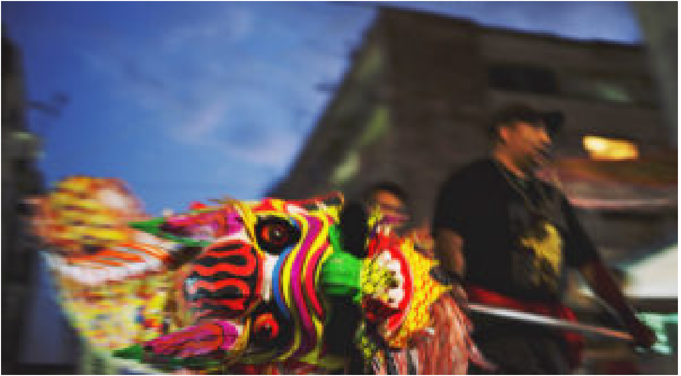
Mexicano agitando el dragón en el Año Nuevo chino

De tal suerte, para que se llevara a cabo la firma del Tratado sino-mexicano se confrontaron varias eventualidades de tipo administrativo, diplomático y burocrático, por mencionar algunas de ellas. Para el período que va de 1838 a 1890, México estuvo muy interesado en llevar dar curso a los trámites necesarios para concretar tal acuerdo; sin embargo, los chinos vivían entonces crisis tan agudas que impidieron llevar a cabo el acto protocolario. De 1890 a 1899 se dio paso a una nueva fase que trajo la consecución de la firma del tratado. Esta vez China fue la que inició las gestiones para fijar las condiciones del mismo. Los chinos tenían prisa, los motivos no eran otros más que las restricciones del gobierno norteamericano para la propia inmigración china, que ya había crecido notablemente en la zona de San Francisco. Fue tanto así que, por ejemplo, para 1860 representaba el 8% de la población de la ciudad; el 26% en 1870 y, en el transcurso de la misma década llegó a un 30% de la población total (González).