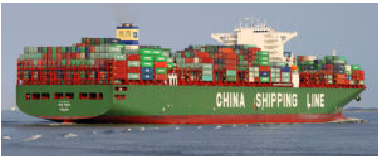
Barco carguero Mexico - China. Siglo XXI

Finalmente, las circunstancias histórico-sociales coincidieron. Tal fue el caso de los puntos de vista de agentes diplomáticos de ambos países, contexto en el que se firma formalmente, al fin, en 1899, el Tratado México-China. “La firma del Tratado sino-mexicano para el año 1899 constituye un eslabón importante de la interminable serie de medidas estatales, tanto del gobierno porfirista como de la dinastía Ching, en su última etapa que pretendió conducir a sus nacionales por el sendero de la modernidad, realizaban un esfuerzo por hacer frente a las potencias, produjeron el efecto contrario o simplemente se cancelaron por los procedimientos de implementación” (Gómez Izquierdo).