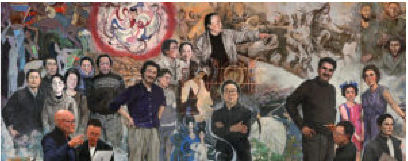
Vientos de Fusang: México y China en el siglo XX. Mural expuesto en 2019

Recordemos que antes de la intervención francesa, México mantuvo relaciones diplomáticas con Inglaterra, la propia Francia, Prusia y los Países Bajos; pero el conflicto con los galos y su gran peso en la geopolítica europea de mediados del siglo XIX influyeron para que estos países dieran por terminadas las relaciones con México, así que por lo pronto seguiría imperando la poderosa y desbalanceada relación con los Estados Unidos, pero aún con una presión más fuerte ante la dolorosa derrota mexicana con el precedente enfrentamiento norteamericano.