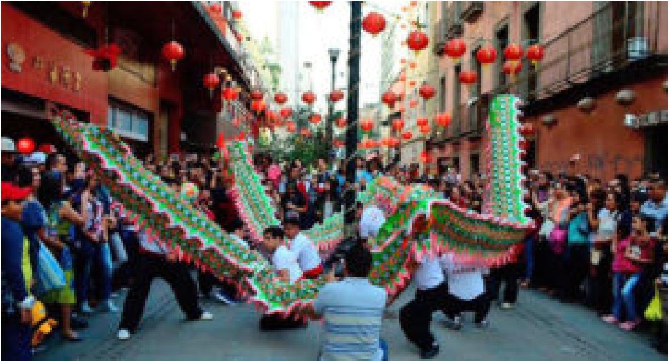
Vista del Barrio Chino en la calle de Dolores, en el Centro de la Ciudad de México

De 1874 a 1890, los contactos sino-mexicanos seguirían dándose a causa de la plata nacional. Hay que destacar que, para este corte histórico, México se ve forzado a proponer un proyecto de modernización capitalista (al igual que China), justo a imagen y semejanza de las grandes potencias capitalistas. Tanto México como China cayeron dentro de los mecanismos de expansión del capitalismo, y los contactos sino-mexicanos de ese período forman parte del mismo proceso. Ninguno de los dos estados ofreció una resistencia adecuada a la presión de las potencias imperialistas: México facilitó la penetración pacífica en aras de la modernización, y China, luego de resistir, tuvo que acceder a su apertura de puertos con tal de efectuar similares transacciones.