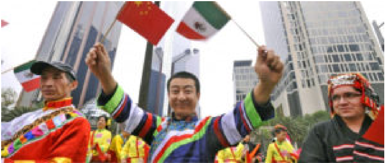
De fiesta juntos, chinos y mexicanos

Finalmente, las circunstancias histórico-sociales coincidieron. Tal fue el caso de los puntos de vista de agentes diplomáticos de ambos países, contexto en el que se firma formalmente, al fin, en 1899, el Tratado México-China. “La firma del Tratado sino-mexicano para el año 1899 constituye un eslabón importante de la interminable serie de medidas estatales, tanto del gobierno porfirista como de la dinastía Ching, en su última etapa que pretendió conducir a sus nacionales por el sendero de la modernidad, realizaban un esfuerzo por hacer frente a las potencias, produjeron el efecto contrario o simplemente se cancelaron por los procedimientos de implementación” (Gómez Izquierdo).