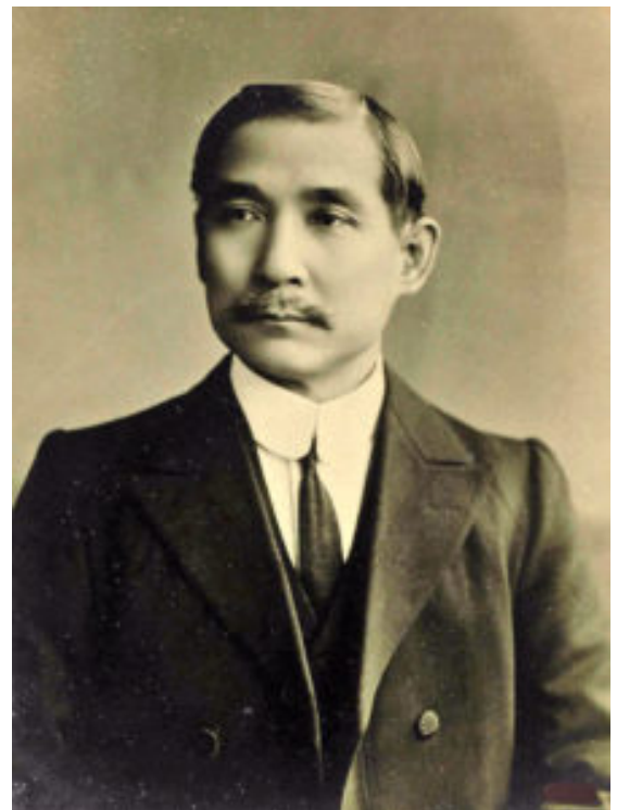
Sun Yat-sen, político e ideólogo