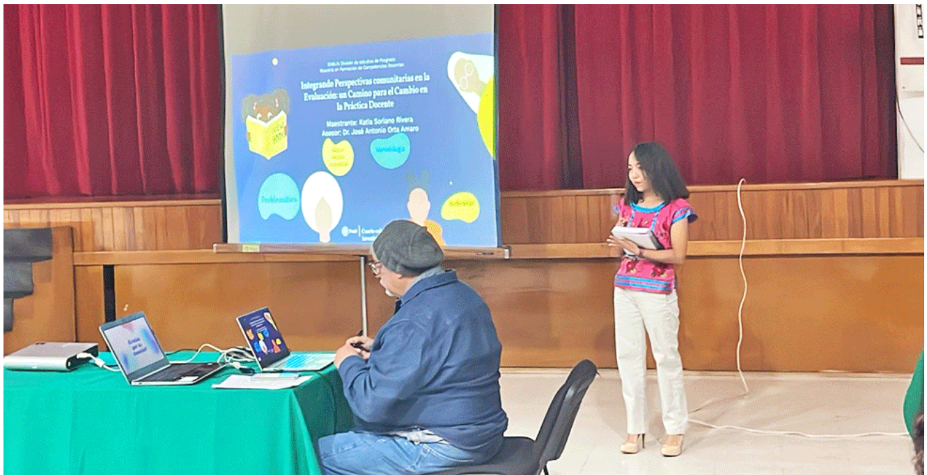
Sesión de trabajo en el auditorio Emma Olguín Hermida, ENMJN

“Los comentarios de los lectores es una mirada de otro experto que nos permite profundizar en nuestras investigaciones, así como compartir con los asesores estas aportaciones para seguir construyendo”