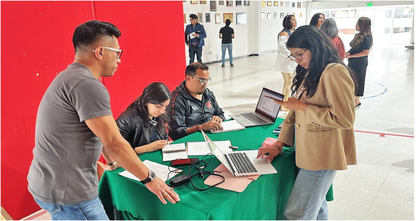
Estudiantes en el 1er Coloquio Inter-Generacional 2024, ENMJN. Maestría en Competencias para la Formación Docente

El lector o lectora de los avances de investigación en el marco de la MCFD es miembro del Comité Tutoral del o la estudiante. Esta figura académica lo acompaña durante todo su proceso formativo, comparte saberes sobre un campo de conocimiento y brinda retroalimentación para el buen logro de la investigación. Una de sus responsabilidades consiste en dar lectura, hacer observaciones y sugerencias a los avances de investigación y a la versión final de la tesis, también participa en el coloquio al final de cada semestre.