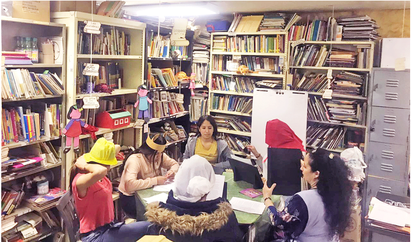
Taller Conoce tu biblioteca durante el ciclo escolar 2019-2020

Los objetivos institucionales están a la vista cuando tenemos claridad en que las actividades fortalecen el perfil de egreso, fomentan la identidad nacional y la cultura cívica, impulsan el desarrollo de la cultura, las artes y promueven la salud, forjando así, una identidad en nuestra institución educativa.