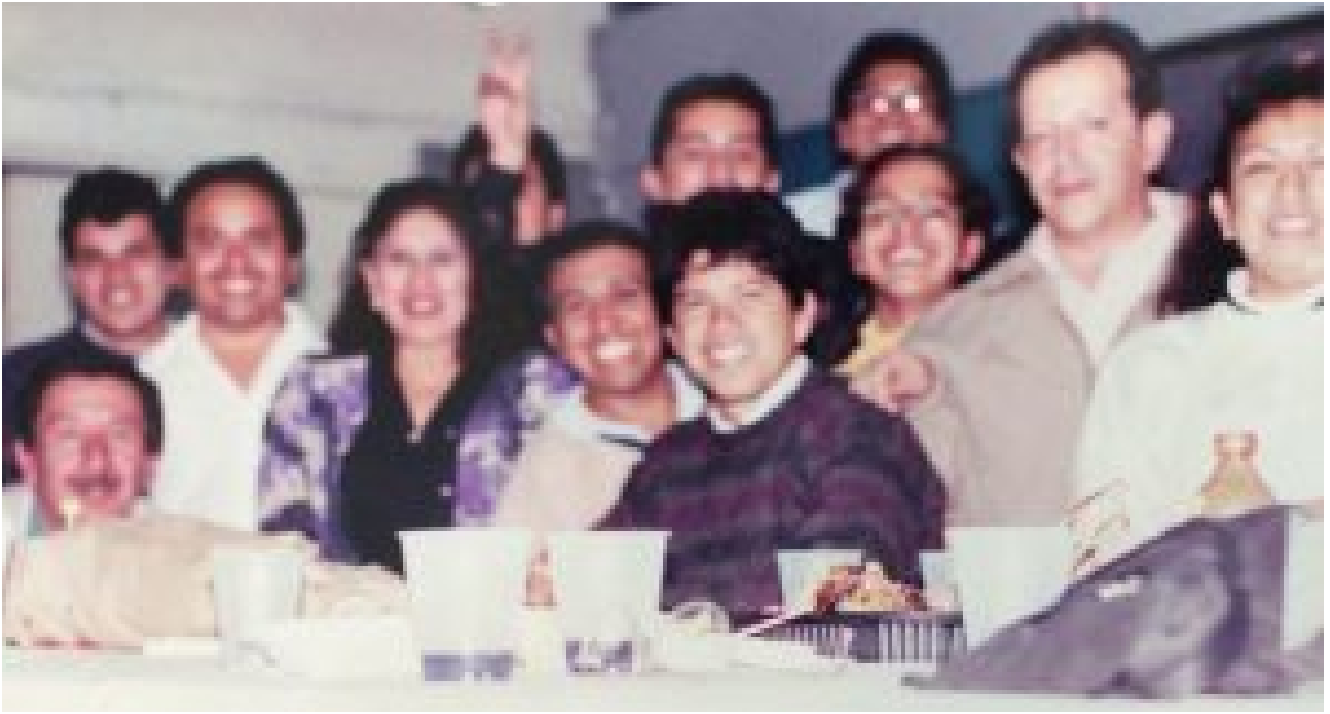
1994. Fin del Curso de Offset en el Cecati Número 13