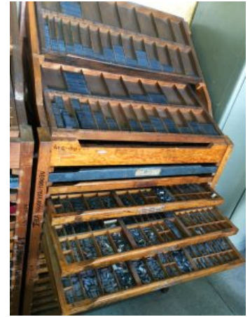
Caja de tipos de metal

Yo aprendí a los 17 años muchas cuestiones de las imprentas, pues mi papá me había llevado a trabajar a la imprenta de un amigo suyo. Fue lavando los tipos metálicos con gasolina que conocí las letras y cómo se acomodaban. Los tipos se ordenan en caballetes que, a su vez, se disponen en la Caja California . Los tipos se ordenan alfabéticamente y por mayúsculas y minúsculas. A la caja de letras se le llama rama, y a lo que va en su interior lo conocemos por forma. Es donde están las regletas y las grapas que sujetan la página para imprimir.