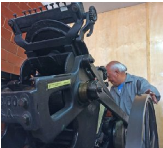
Operando la máquina Chandler

Yo aprendí a los 17 años muchas cuestiones de las imprentas, pues mi papá me había llevado a trabajar a la imprenta de un amigo suyo. Fue lavando los tipos metálicos con gasolina que conocí las letras y cómo se acomodaban. Los tipos se ordenan en caballetes que, a su vez, se disponen en la Caja California . Los tipos se ordenan alfabéticamente y por mayúsculas y minúsculas. A la caja de letras se le llama rama, y a lo que va en su interior lo conocemos por forma. Es donde están las regletas y las grapas que sujetan la página para imprimir.