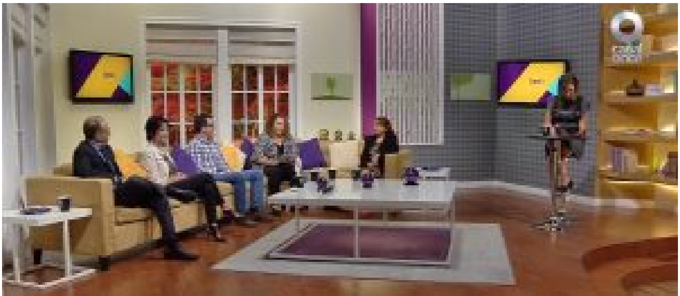
Panel de especialistas en distintas áreas del conocimiento, durante el programa Diálogos en Confianza.

El capital cultural familiar también influye en el modelo educativo, la filosofía y el sistema en el que quieren formar a sus hijos (as), lo cual implica un enfoque pedagógico y metodologías de trabajo, por ejemplo: métodos activos, metodología Montessori, etc. Aunado al capital cultural, el nivel económico es un factor importante en la toma de decisiones, principalmente para distinguir entre escuelas públicas y privadas.