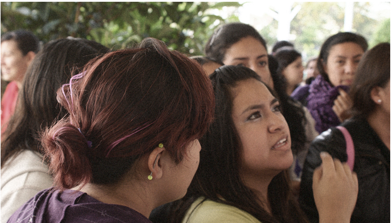
Alumnas de la ENMJN

En concordancia con el Plan Nacional de Desarrollo, donde una de las metas señala un México con Educación de Calidad , se elaboró el Programa Sectorial de Educación 2013- 2018, del que derivan 6 objetivos con sus respectivas estrategias y líneas de acción.