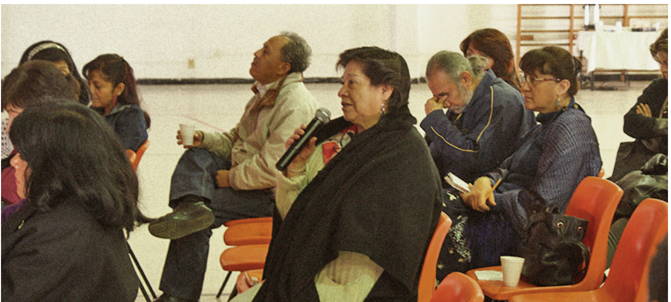
Debate de docentes de la ENMJN. Auditorio Emma Olguín.

Como institución de Educación superior, la Escuela Nacional para Maestras de Jardines de Niños (ENMJN), a través de su Área de investigación, se alinea a los documentos antes mencionados, en el marco de la planeación estratégica, mediante el Plan Anual de Trabajo 2016, en el se cual establece ,dentro de una de sus actividades, impulsar encuentros académicos entre las áreas de investigación de diversas Instituciones de Educación Superior (IES) que abordan el estudio de la educación.