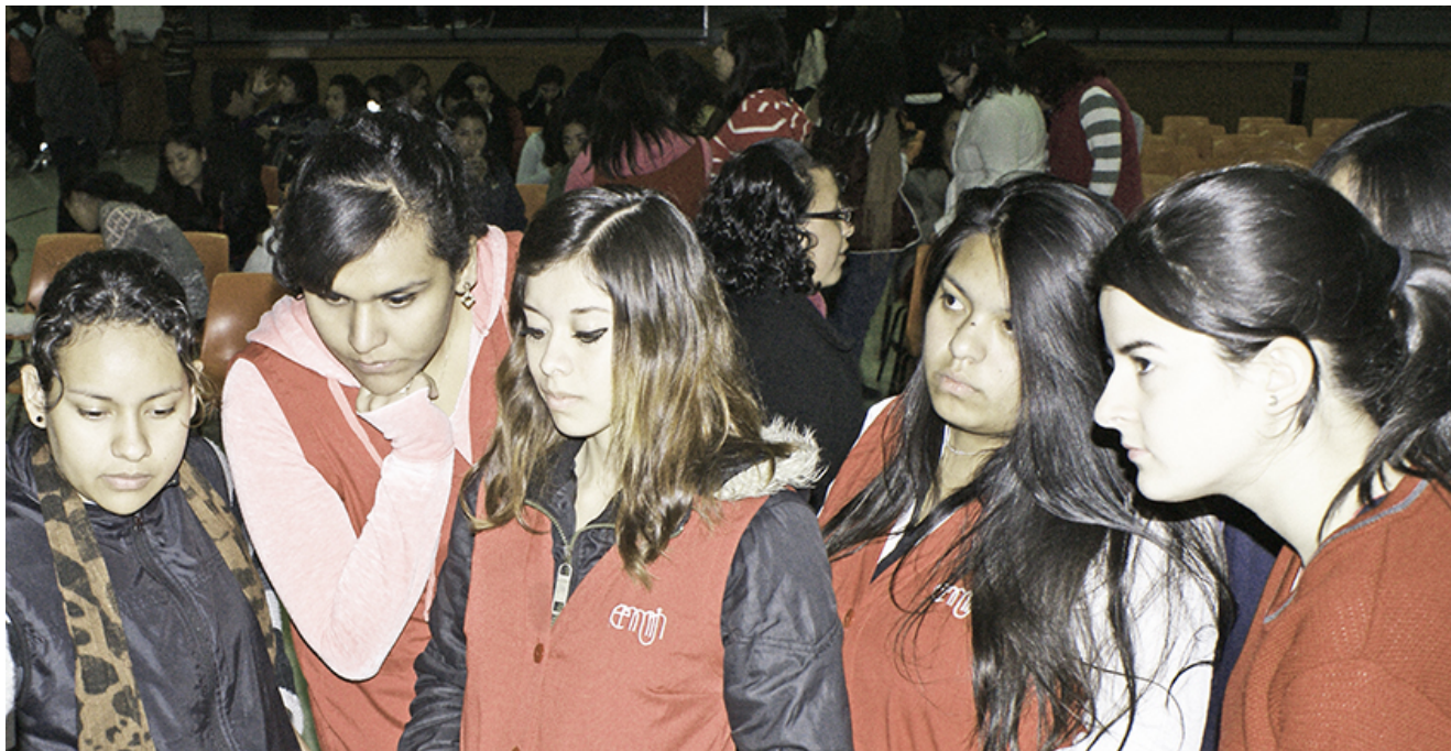
Alumnas de la ENMJN, durante un Foro de debate y ciencia.

Tiempo aproximado del trabajo académico: 3 horas para cada mesa.