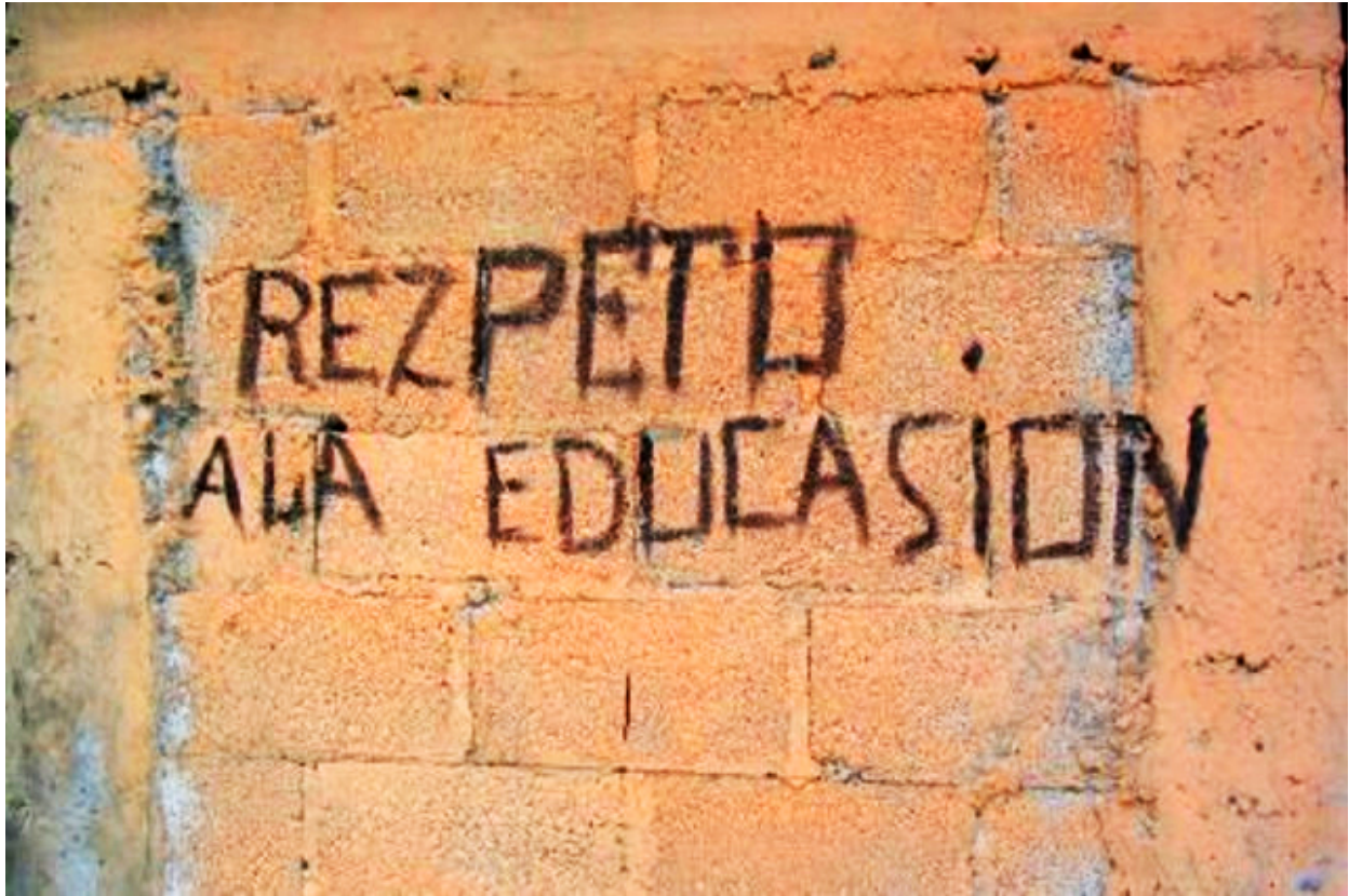
Pinta callejera hallada en México

chat y mensajería instantánea. Se propagó con el auge de la mensajería instantánea y el servicio de mensajes cortos. Pero este lenguaje no es universal, ya que cada idioma cuenta con un conjunto de reglas en función de las abreviaciones posibles y de la fonética propia de cada lengua.