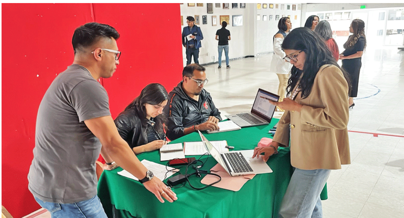
Estudiantes en el 1er Coloquio Inter-Generacional 2024, ENMJN. Maestría en Competencias para la Formación Docente