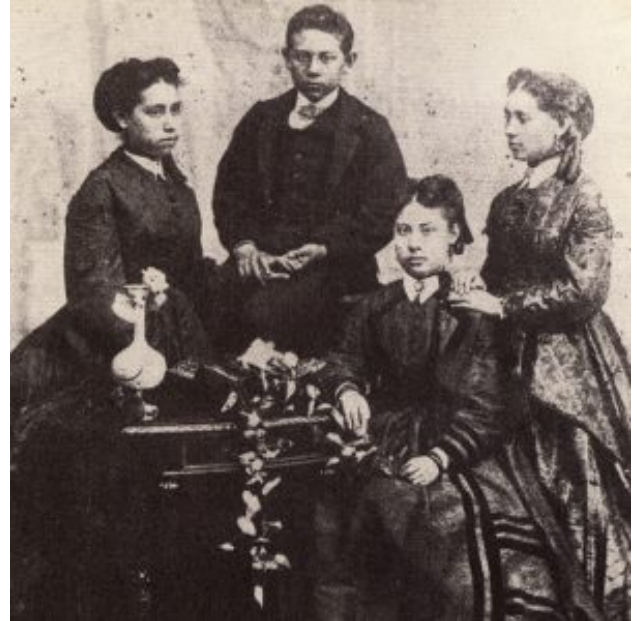
Hijos de Benito Juárez y Margarita Maza

fuerza europea, representada por los franceses, favoreció una política ventajosa para los estadounidenses y prácticamente les abrió las puertas de todos los sectores de nuestro país. Para muchos, Juárez fue el primer “padrino” de las difíciles e históricas relaciones México-Estados Unidos. Jaime del Arenal Fenochio, concluye que “Juárez simboliza la adhesión (o alineación) de México a la órbita económica y política de Estados Unidos de América...”[14].