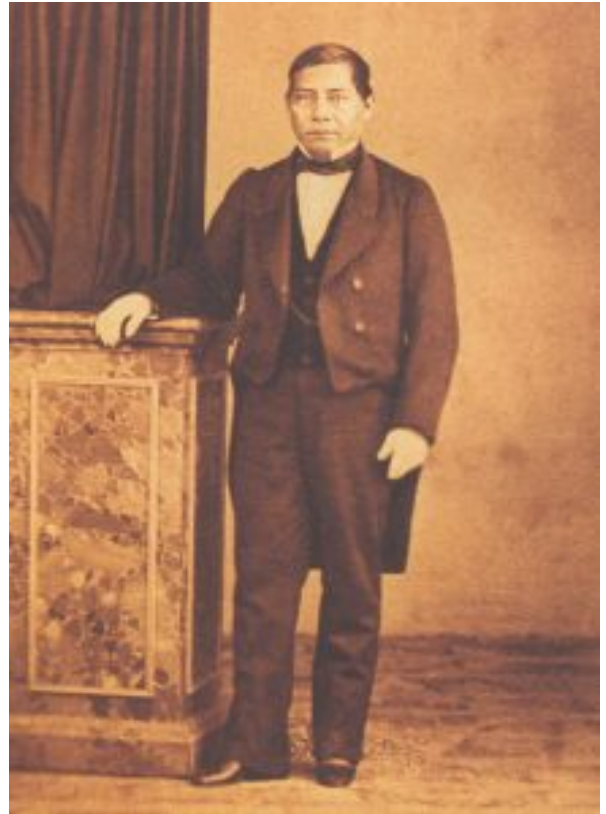
Benito Juárez, presidente de México

Hay que destacar, que Juárez fue uno de los primeros abogados que se titularon en el Estado de Oaxaca, lo que muchos no alcanzaron en su propia tierra, según se dice, pues prácticamente era imposible titularse en el Tribunal Superior de Justicia, debido al alto nivel de exigencia y por lo que los candidatos optaban por titularse en otros estados. “Por tanto, la matriculación de Juárez representaba una reivindicación de las nuevas instituciones estatales establecidas con arreglo a la Constitución Federal de 1824”[4]. Contrariamente al adagio, Juárez si fue profeta en su estado. “Es a principios de enero de 1834 cuando Juárez se recibió de abogado y unos días después fue nombrado juez interino”[5].