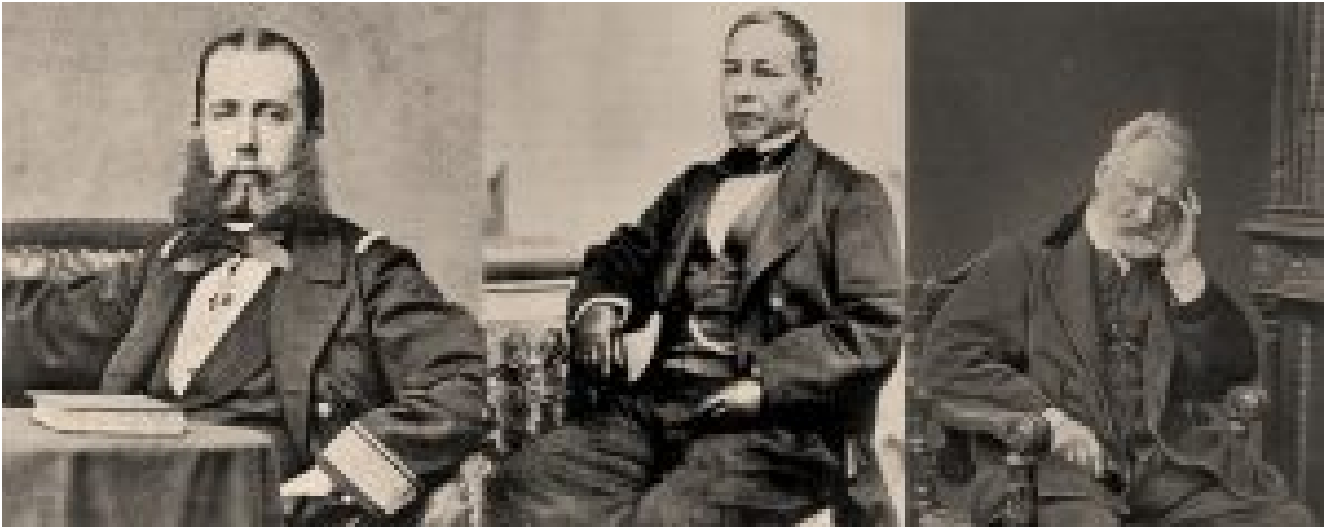
Maximiliano de Habsburgo, Benito Juárez y Victor Hugo

Metodológicamente, no podemos sustraer a Juárez del momento histórico. La actuación de Juárez fue en circunstancias muy particulares, en la etapa de formación del Estado mexicano, caracterizada por las luchas intestinas e intervenciones extranjeras. Es lamentable que la figura de Juárez se haya utilizado, en todos los momentos de la Historia de nuestro país, para justificar los más diversos intereses, sobre todo, los de aquellos que detentan el poder del momento.