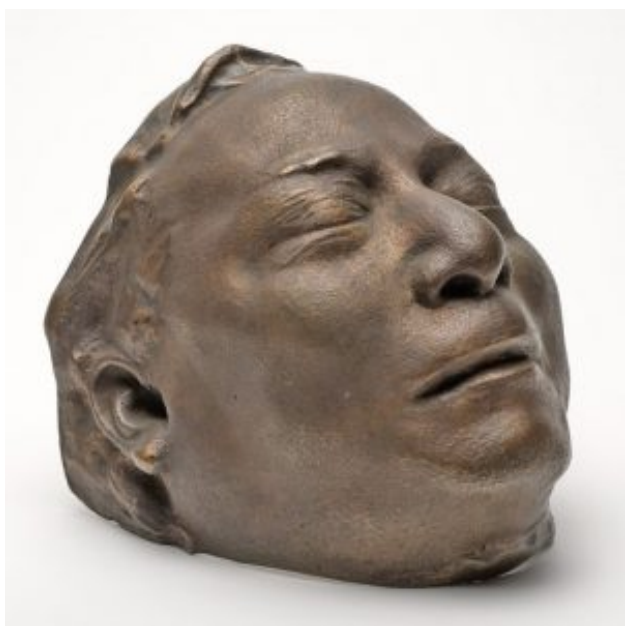
Máscara mortuoria de Benito Juárez

La segunda Ley de 1856, llamada Ley Lerdo , fue para desamortizar los bienes del clero y los bienes comunales. No los nacionalizaba; sólo obligaba al clero a vender sus propiedades a particulares. Asimismo creaba la ley del Registro Civil, la libertad de Cultos, el matrimonio civil y secularizaba los cementerios. Se dice que tanto la Ley Juárez y la Ley Lerdo atacan frontalmente a la Iglesia, por lo que Juárez era considerado el enemigo número uno de la iglesia, pero a decir verdad, el grupo liberal buscaba lo contrario, más bien procuraba mantener a la iglesia en el centro del proyecto modernizador. Así, el mismo Juárez, como comenta Narváez, al terminar el proyecto de ley inmediatamente se lo presentó al Sr. Obispo para obtener su aprobación.