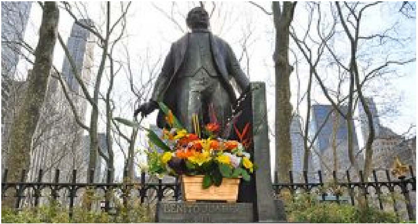
Estatua homenaje al benemérito de las Américas, en el Central Park, Nueva York

Para sus peores críticos todo eso significaba dictadura, y veían en Juárez una extraña fascinación por el poder. “Desde 1855, la prensa decimonónica calificó a todas las administraciones presidenciales como dictaduras... Otros pensaban que, las facultades extraordinarias no solamente habían sido la respuesta práctica a los límites que la Constitución de 1857 imponía a los poderes del presidente, sino para ello es fundamental entender el entorno donde se movía Juárez y su generación, por la compleja anormalidad que vivía el país” [12] .