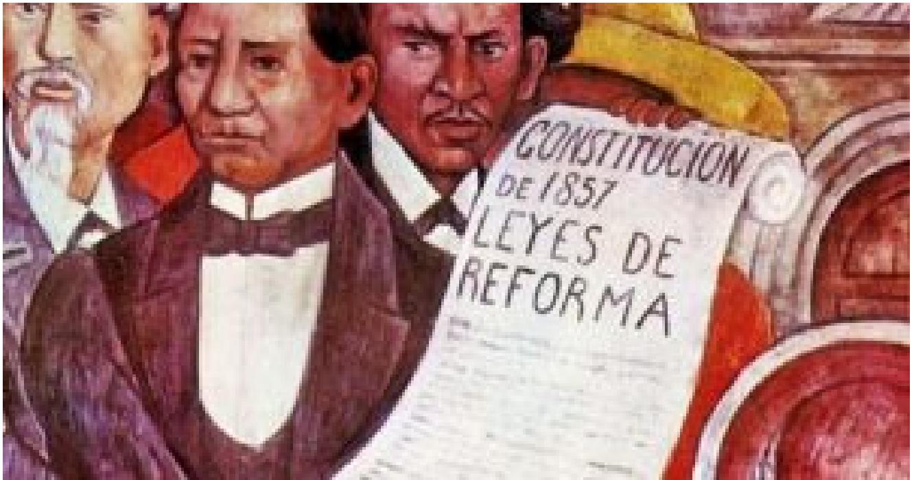
Mural sobre las Leyes de Reforma de 1857

A manera de conclusión podemos decir que el siglo XIX fue en América Latina el siglo de la religión a la patria. En México, a pesar de la constante lucha por parte de los liberales en contra la iglesia que mermó hasta cierto punto su poder, no fue suficiente para borrar a la iglesia del panorama político nacional. Como consecuencia, hasta nuestros días, la Iglesia detenta un inmenso poder de tipo “espiritual-material”, por lo que sigue siendo una realidad extremadamente compleja.