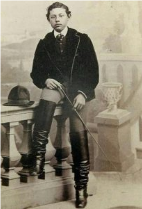
Benito Juárez Maza en estilo victoriano

Otro problema, que no permite dimensionar en su totalidad la vida y obra de Juárez, es que no se ha investigado otro tipo de fuentes archivísticas que den cuenta de nuevos aspectos de la vida del Benemérito. Un ejemplo de ello es la documentación que se encuentra en el Archivo General de la Nación presentada en el Catálogo Benito Juárez García. En la descripción de su serie documental, nos da a conocer la correspondencia con su hija Vela; conjunto de textos que, al parecer, son documentos inéditos no incorporados a su conocida obra Apuntes para mis hijos ; asimismo, esta serie presenta otros escritos en los que da a conocer las relaciones familiares. Se puede afirmar que el Juárez padre de familia todavía no ha sido estudiado con profundidad.