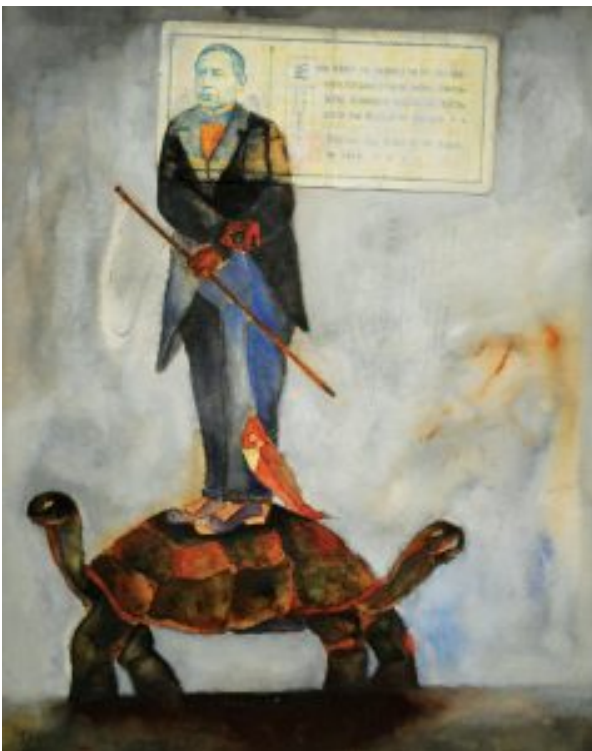
Benito Juárez por Francisco Toledo

Metodológicamente, no podemos sustraer a Juárez del momento histórico. La actuación de Juárez fue en circunstancias muy particulares, en la etapa de formación del Estado mexicano, caracterizada por las luchas intestinas e intervenciones extranjeras. Es lamentable que la figura de Juárez se haya utilizado, en todos los momentos de la Historia de nuestro país, para justificar los más diversos intereses, sobre todo, los de aquellos que detentan el poder del momento.