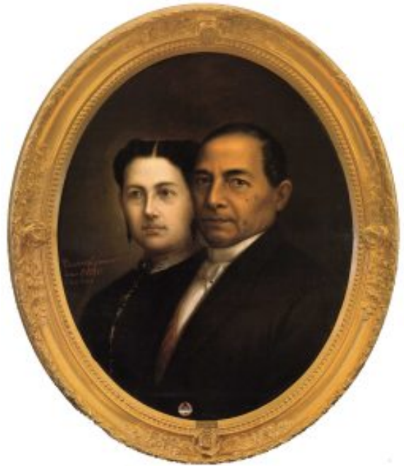
Presidente Juárez y Margarita Maza

Desconocemos la actuación de Juárez como Juez de lo Civil y de Hacienda (1836-1942) en el Estado de Oaxaca que, si bien es cierto que el papel más fuerte de Juárez fue como estadista y no como administrador de la justicia; no obstante, la Casa de la Cultura de Jurídica de Oaxaca conserva y resguarda algunos de los asuntos que resolvió el Juez Benito Juárez García. Este tipo de fuentes no se ha estudiado por los investigadores del derecho. Y aunque no se trata de grandes series documentales que permitan sustentar alguna línea de investigación, sí podrían dar indicios del pensamiento jurídico del Benemérito de las Américas.