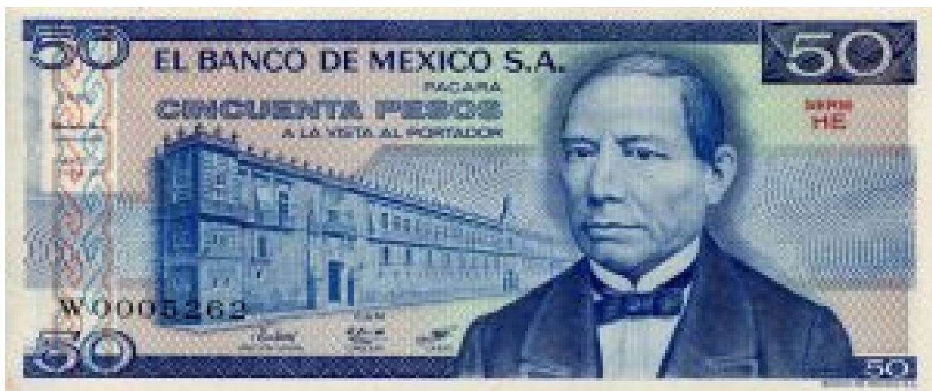
Billete de 50 pesos con la efigie de Benito Juárez

Pero si la formación de Juárez fue inminentemente jurista, ¿en qué momento se apartó de ella para convertirse en el mejor estadista que ha tenido nuestro país. Este paso se dio, desde su primer nombramiento como gobernador del estado de Oaxaca y con su inclusión dentro del Partido Liberal (puro o radical[8]). Esta primera etapa de jurista se caracterizó por una fe ciega en la “Ley”, como principio fundador de la sociedad mexicana de mitad de siglo XIX. Consecuencia de ello, y como fundamento de que a lo largo de los años irá tomando cuerpo en Juárez, es su entendimiento sobre lo que implica la autoridad. Aunque conocía los elementos que constituyen una autoridad literaria o científica, perseguía construir una autoridad, primero jurídica, luego moral y, finalmente, cívica en su acepción social.