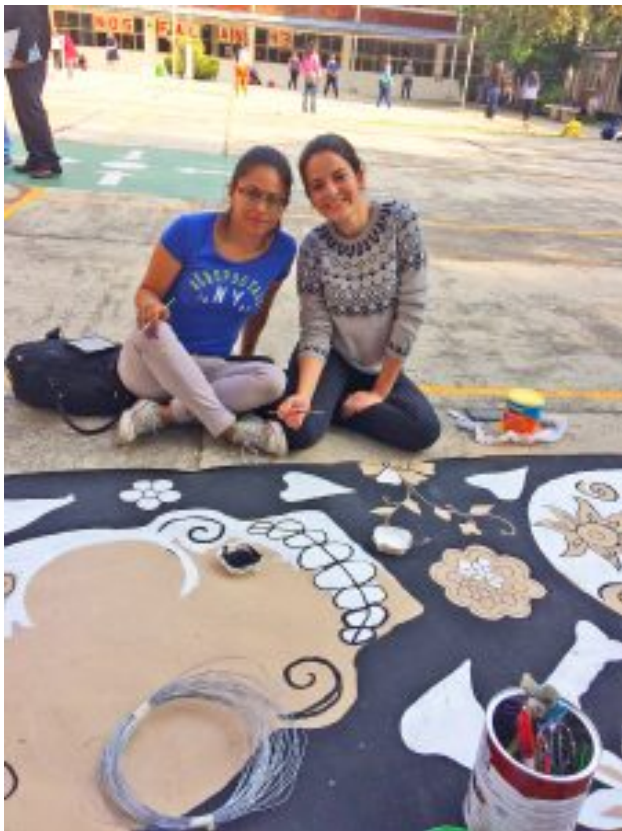
Estudiantes de la ENMJN preparando con empeño sus trabajos para la