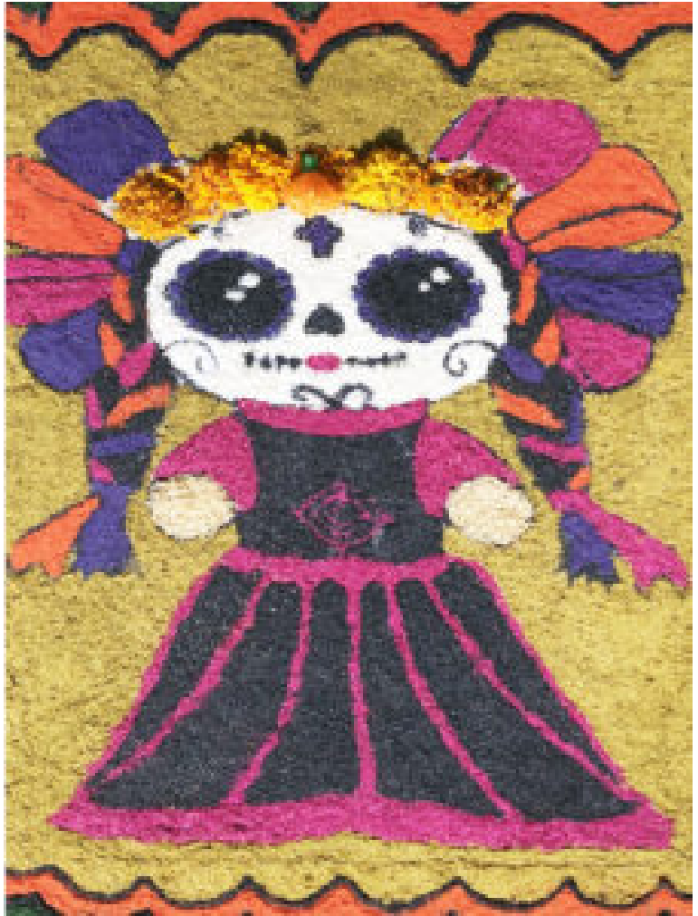
Tapete de muñeca mexicana típica