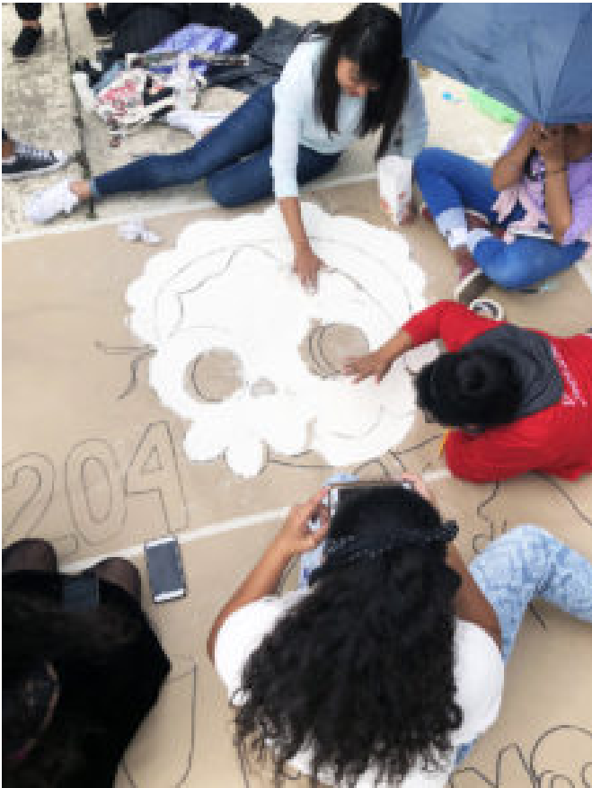
Estudiantes trabajando en el tapete de María Montessori

más de una risa en varias ocasiones; sin duda, fue el momento humorístico del programa. Llegó luego el momento de escuchar al recién conformado Ensamble Instrumental de la ENMJN , integrado por trabajadores y docentes, acompañados para este evento, así como de las estudiantes de los grupos 301, 302 y 402, todos ellos dirigidos por el Mtro. Adrián González Peña. Su participación, alusiva a la fecha fue: La Llorona .