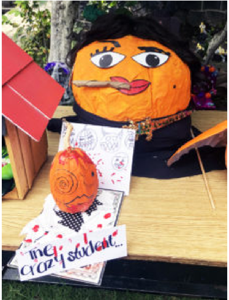
Detalle de ofrenda de Halloween

Muchas caritas sonrientes por haber quedado ahí. La muerte pelando dientes no dejaba de reír.