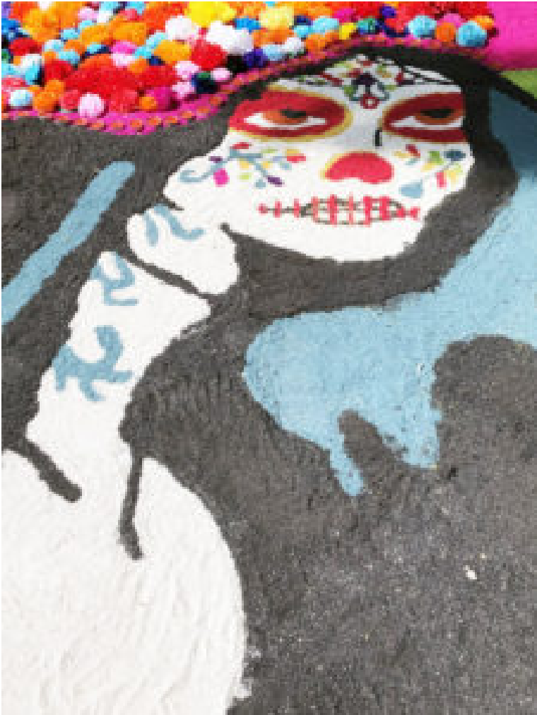
Tapete de "La Catrina"

No me lleves, Calaquita Soy muy nueva en la gestión Pero amo esta escuelita, Con todo mi corazón.