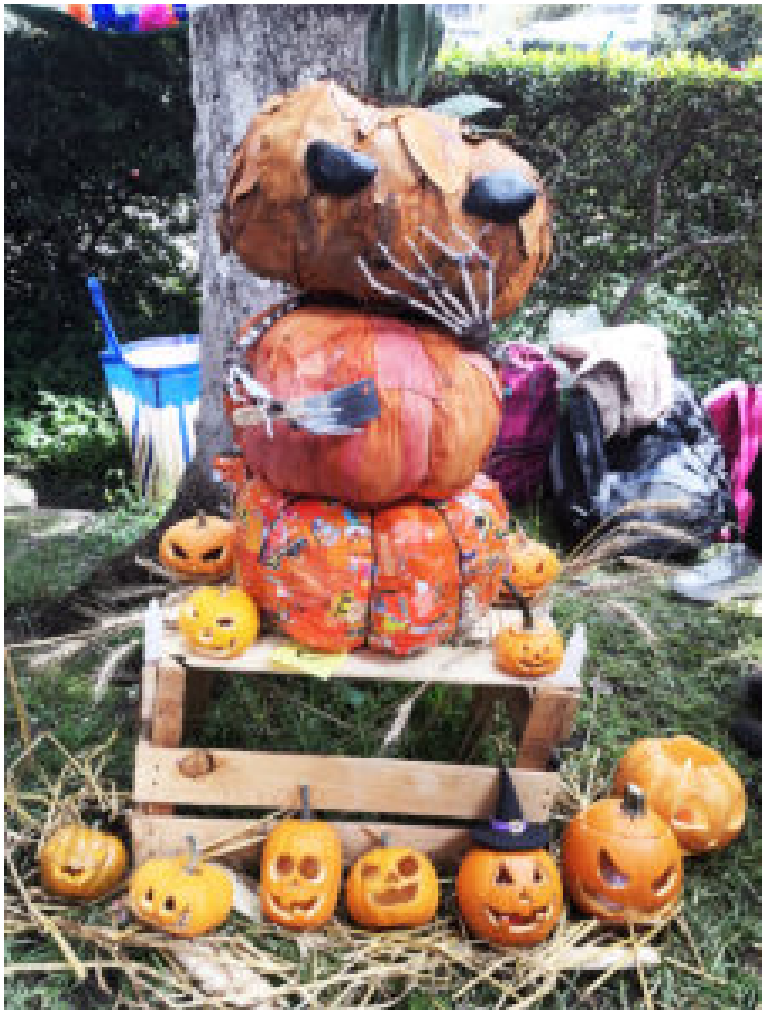
Personaje elaborado con calabazas

Necesito sangre nueva mentes e imaginación, que la práctica se mueva sólo con el corazón.