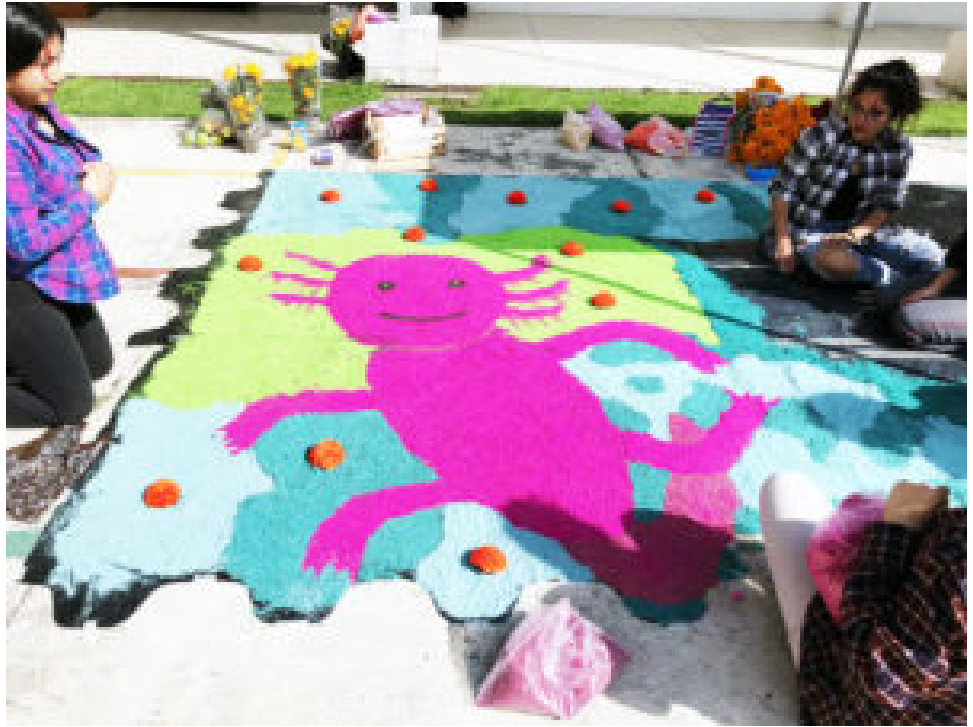
Tapete elaborado en vistosos colores por las estudiantes: El Ajolote

Ya la muerte reflexiona, piensa y piensa sin cesar que a la niñez emociona ir a la escuela... su hogar.