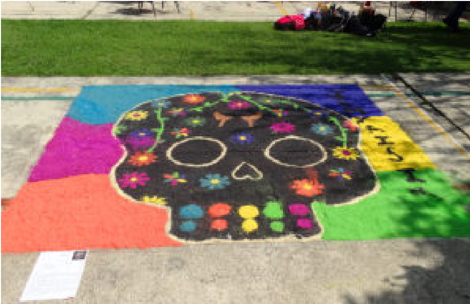
Tapete de estudiantes del grupo 402: "La última y nos vamos"

Esta celebración proviene de nuestro pasado histórico y cultural que nos da identidad como mexicanos. En todos los estados de la república mexicana, las diferentes comunidades se reúnen para montar altares y ofrendas pensando en aquellos que se han ido del plano físico y terrenal. Para nosotros, estas acciones no son sólo una forma de recordar a los difuntos; también son un buen motivo para fomentar el trabajo colaborativo, el respeto, la tolerancia, el empeño y, desde luego, promover las tradiciones mexicanas.