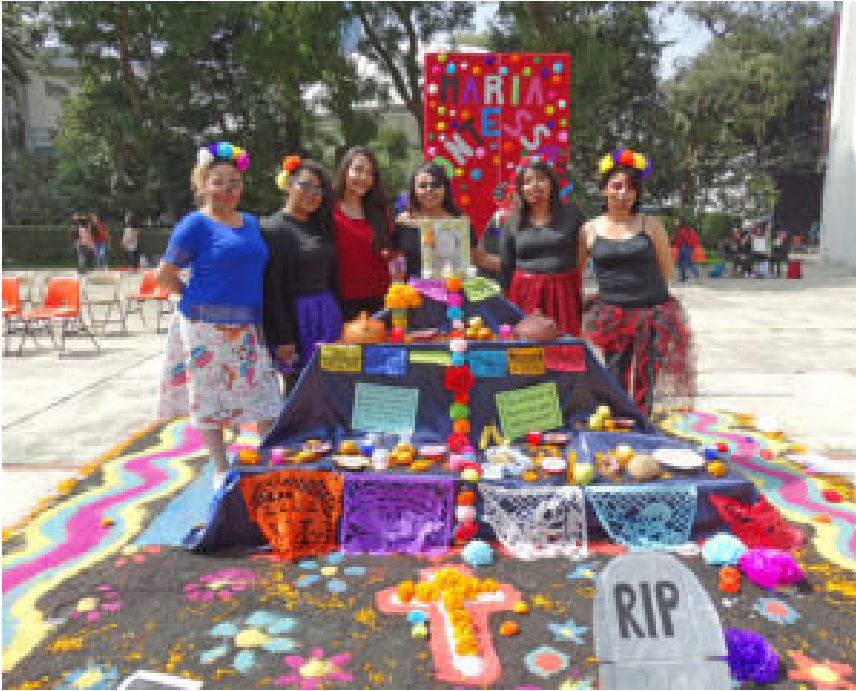
Ofrenda y tapete en honor a María Montessori. Estudiantes del grupo 105

La Catrina presurosa Se las quiere ya cargar, Y con su bata orgullosa, Se ha venido a disfrazar.