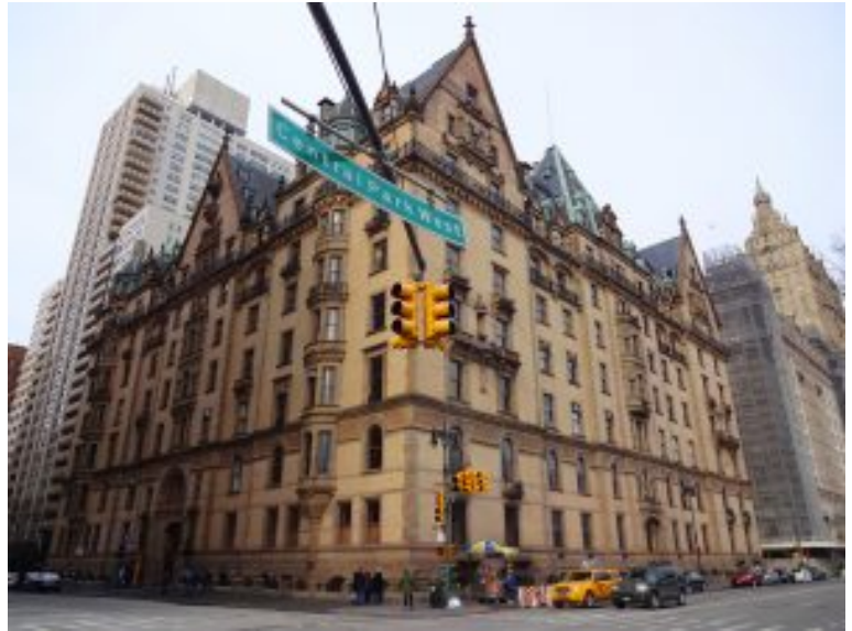
Edificio Dakota en Nueva York

“La declaración de John Lennon, que provocó una profunda indignación, después de muchos años suena tan sólo como una fanfarronada de un joven de clase trabajadora de Inglaterra, que tuvo que afrontar un éxito inesperado, después de crecer en la leyenda de Elvis Presley y del rock and roll.”