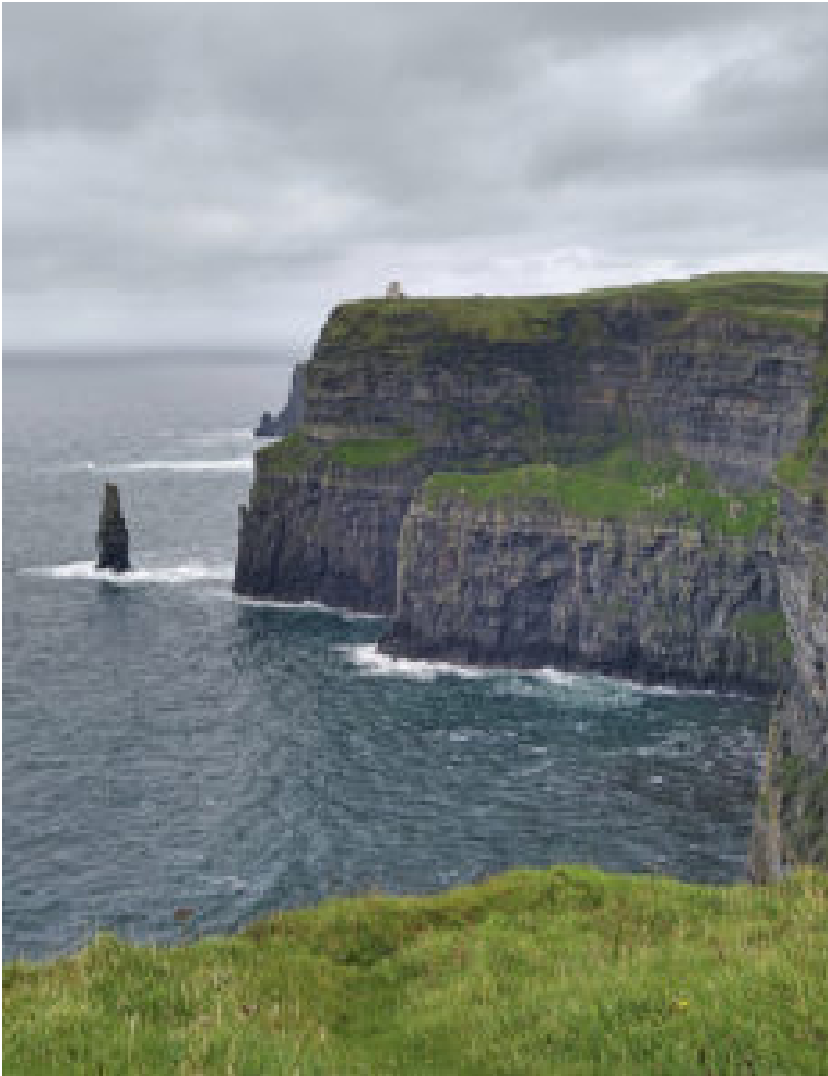
Cliffs (acantilados marinos) irlandeses

En Irlanda aprendí infinidad de cosas acerca de su cultura, su sociedad, su educación y, sin duda, sobre sus ideas de inclusión. Considero que, luego de escuchar a todos los maestros que nos hablaron sobre lo que es inclusión para ellos y cómo es que la practican, es imposible no hacerme más consciente de aquello que puedo cambiar para que mi aula pueda ser asimismo un aula inclusiva. Y entre esas cosas que puedo cambiar me refiero a mi forma de pensar, al lenguaje que utilizo día a día, a la forma de referirme a los niños y niñas, y en general a la forma de tratar a las personas.