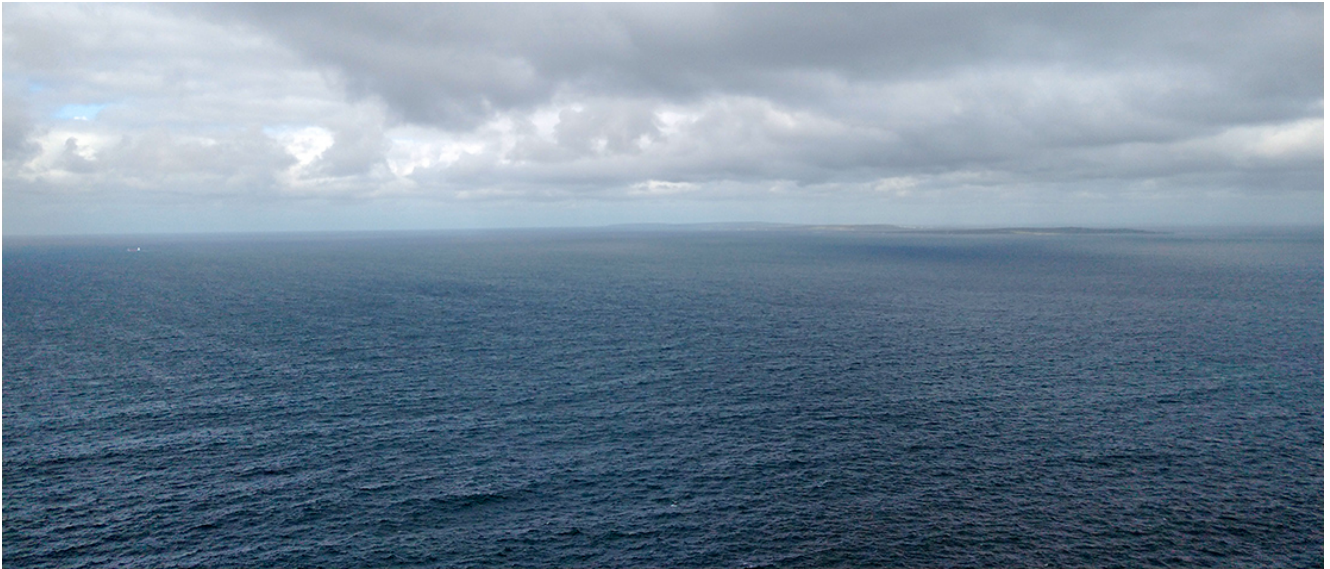
Vista del Mar del Norte. Irlanda

Otro de mis lugares favoritos fueron los Cliffs of Moher, unos acantilados impresionantes. Al principio, algunos de mis compañeros y yo estábamos algo decepcionados porque la visita a los Cliffs estaba programada para los primeros días y ya la habían hecho cuando nosotros llegamos a Irlanda. No obstante, el staff del MIC una vez más nos sorprendió con su hospitalidad y amabilidad pues acomodaron el programa para que, los que no habíamos ido a los Cliffs, pudiéramos hacerlo. Fue una experiencia maravillosa, me hubiera gustado estar mucho más tiempo ahí. El paisaje es precioso por donde se lo vea. Todos van a tomarse fotos a los famosos Cliffs, ni siquiera tienes que pedir que te tomen foto porque los propios turistas se ofrecen para que luego tú les devuelvas el favor. Sin embargo, un dato curioso sobre los Cliffs of Moher es que es un lugar conocido también por los suicidios que han sucedido en ellos, de hecho, es algo muy común no sólo en los Cliffs sino también en Limerick. Algo escalofriante.