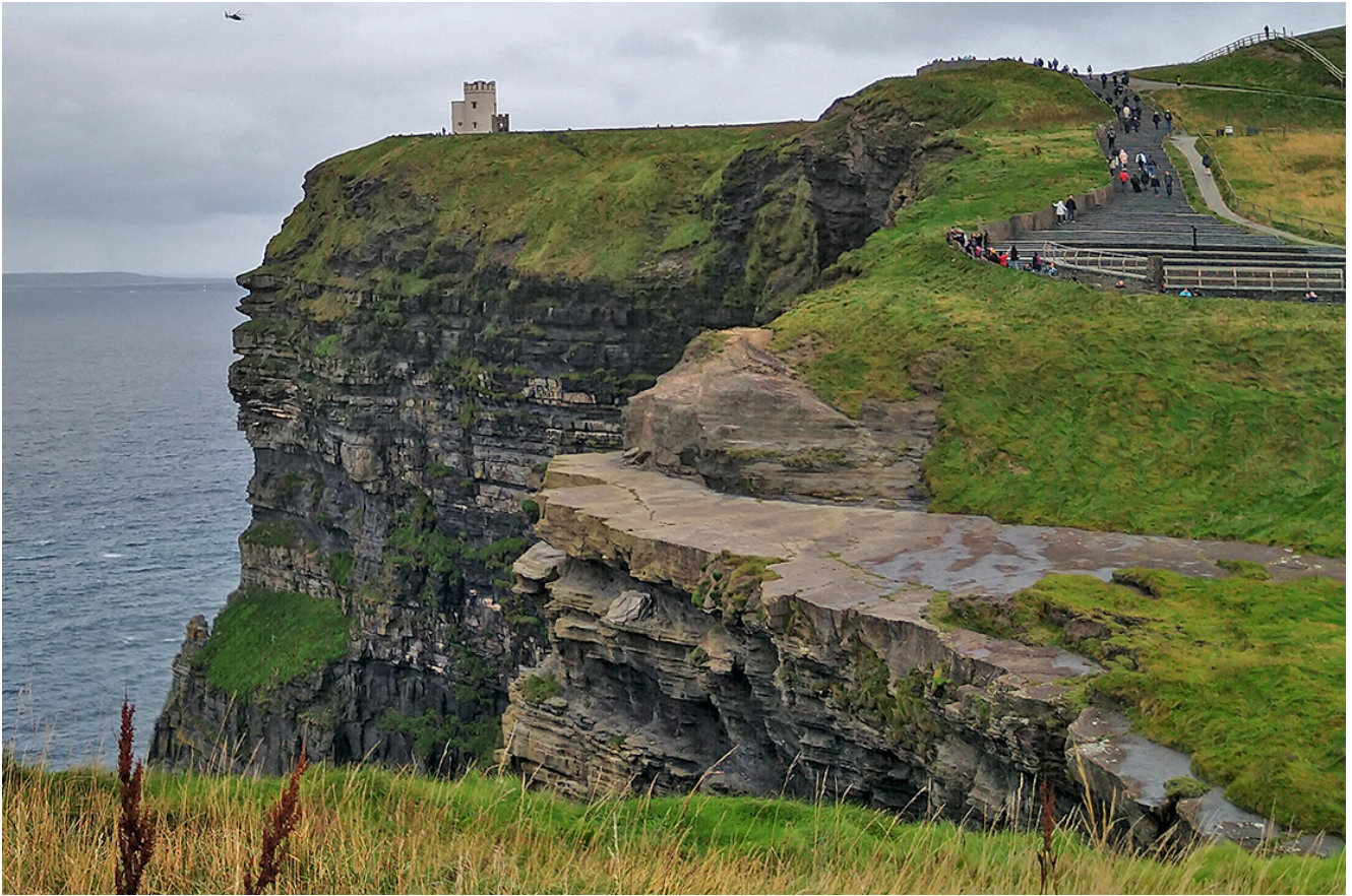
Vista de los Acantilados (cliffs of Moher). Escalinata y construcción medieval

Luego de pasar algo de ansiedad por las esperas y la incertidumbre entre los correos y algunos cambios institucionales de las fechas establecidas, toda la agitación llegó a su clímax cuando nos avisaron que idebíamos estar al día siguiente en el aeropuerto con todo listo!... Sin embargo, con tanta gente en fila, no todos nos pudimos ir ese día. Así que, ni modo, hubo que regresar a casa... Recuerdo que en el aeropuerto había muchos normalistas de diferentes estados que no podían regresar tal fácil a casa, por lo que tuvieron que quedarse en un hotel cerca del aeropuerto que les fue ofrecido. En todo momento, quienes estaban encargados de acompañarnos se mostraron muy amables y comprensivos ante nuestras dudas e inquietudes. De la Ciudad de México ya sólo quedábamos cuatro normalistas que no nos habíamos ido, así que el viernes por fin recibimos el llamado que tanto esperábamos y ese día a las 11 de la noche nuestro vuelo salió rumbo al anhelado país del viejo mundo.