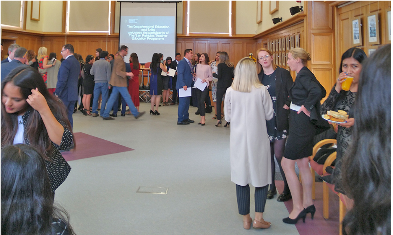
Evento de convivencia entre normalistas normalistas mexicanos y académicos del Mary Immaculate College (MIC)