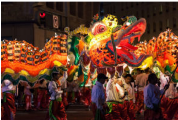
festejo del año chino, en el centro de la capital

Los indicios de la relación sino-mexicana (o chino-mexicana) son muy antiguos, los encontramos desde la época colonial en la Nao de China , con sus largas travesías desde lejano oriente hasta puertos españoles, y, sin duda, hasta la Nueva España y a Filipinas; en este recorrido, eran transportados diversos productos chinos, tales como seda, porcelana, especias, té verde, etc. De manera complementaria, había diversos productos de la Nueva España, como la plata mexicana, que eran llevados por las mismas embarcaciones hacia los mercados chinos y de Japón. Por cierto, este valioso metal va a ser el producto (por parte de México) que, de alguna u otra forma, sustentará las relaciones México-China de finales de siglo XIX.