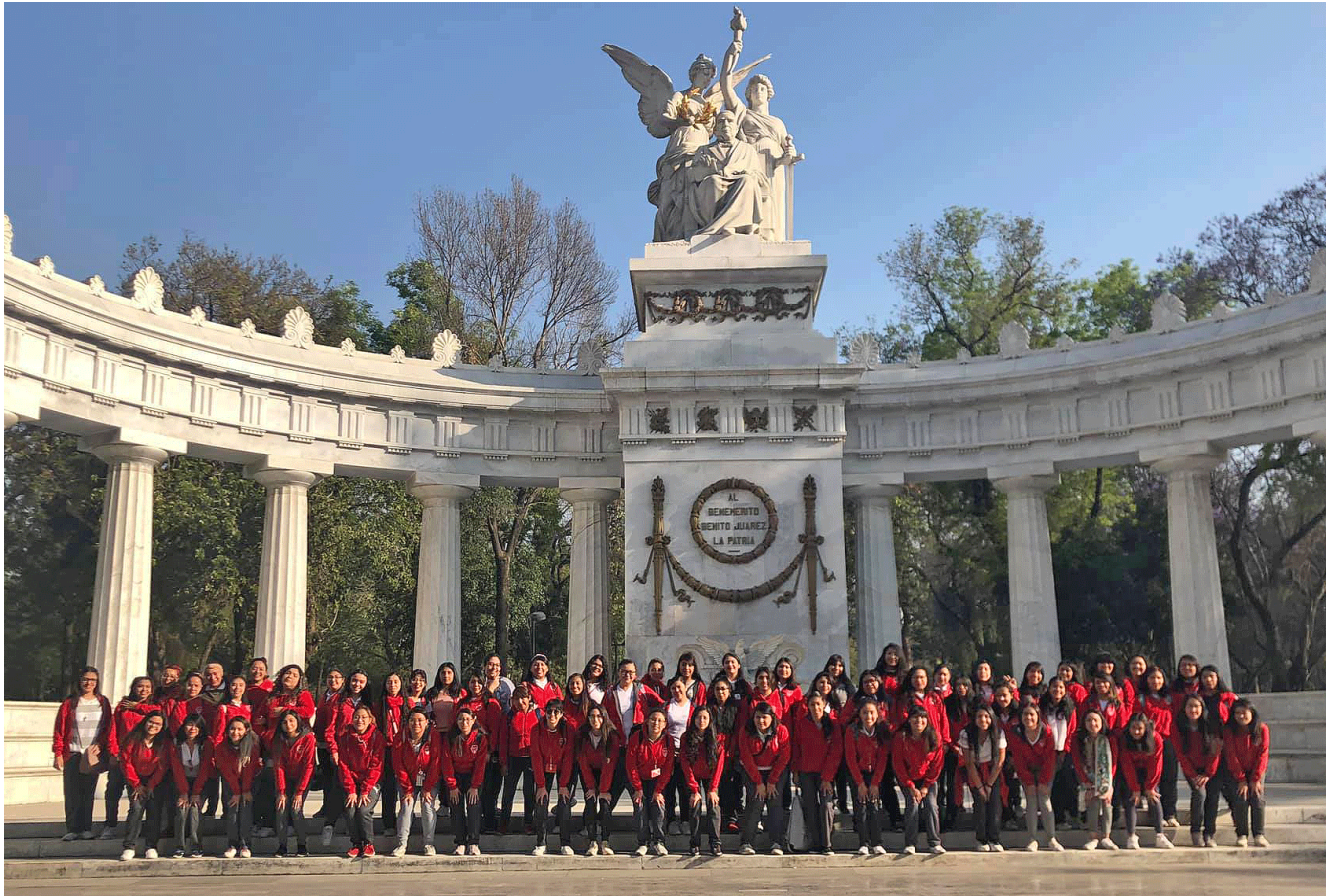
Alumnas del 203 luego de la visita al Museo de Memoria y Tolerancia. Principios de 2020

https://www.youtube.com/watch?v=xfcp_phx1Ds&feature=youtu.be