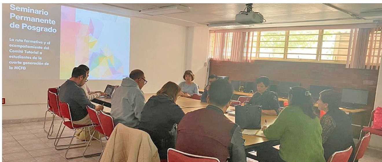
Trabajo colaborativo en las sesiones del seminario

del 13 de marzo al 26 de junio de 2025, y lleva por título: Los Comités Tutoriales, un ejercicio de mediación y acompañamiento en la elaboración de la tesis de investigación. Encuentros dialógicos V , en sesiones presenciales y en línea, con un horario de 13:30 h a 15:30 h.