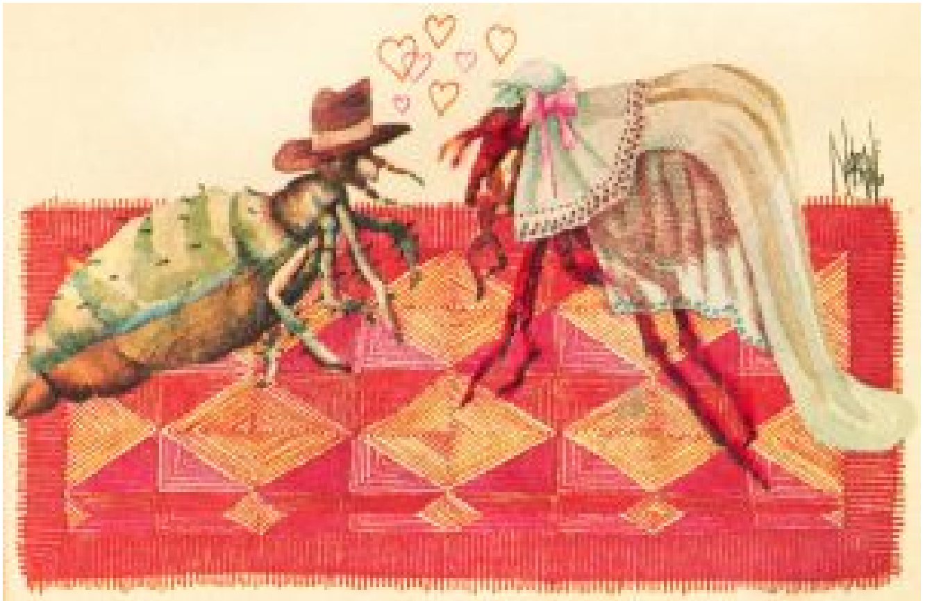
Ilustración de "El piojo y la pulga". Autor: Naranjo